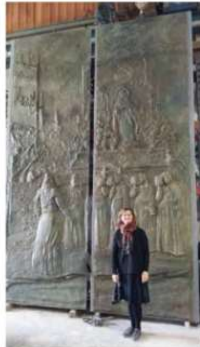
Bajorelieve en bronce Puertas de la Salvación