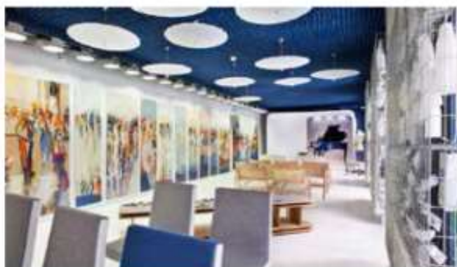
Casa Decor 2014 - Premio del jurado al mejor espacio