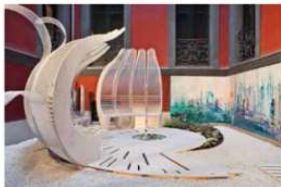
Casa Decor 2016