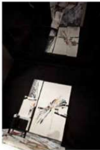
Casa Decor 2015